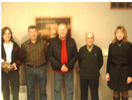
Félicitations aux récipiendaires